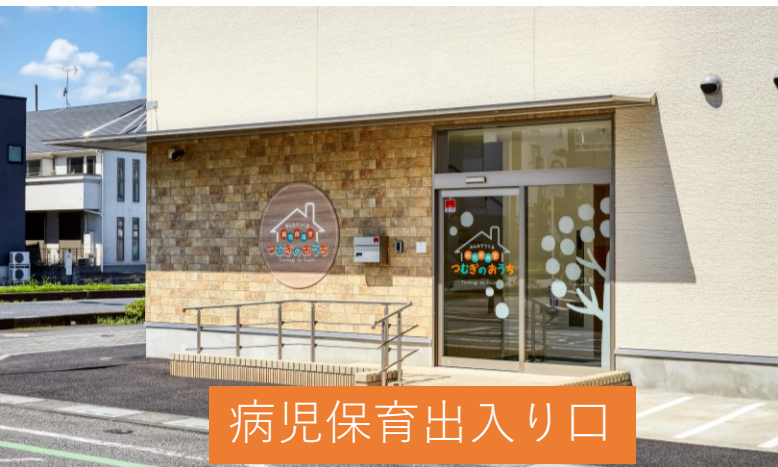
病児保育出入り口