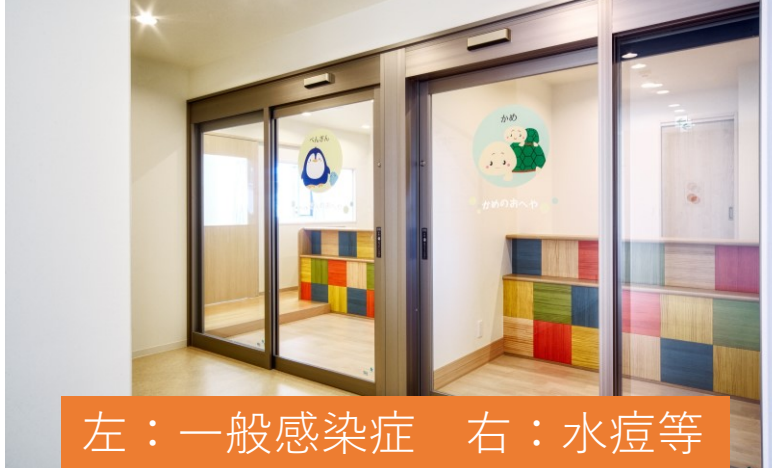
左：一般感染症 右：水痘等